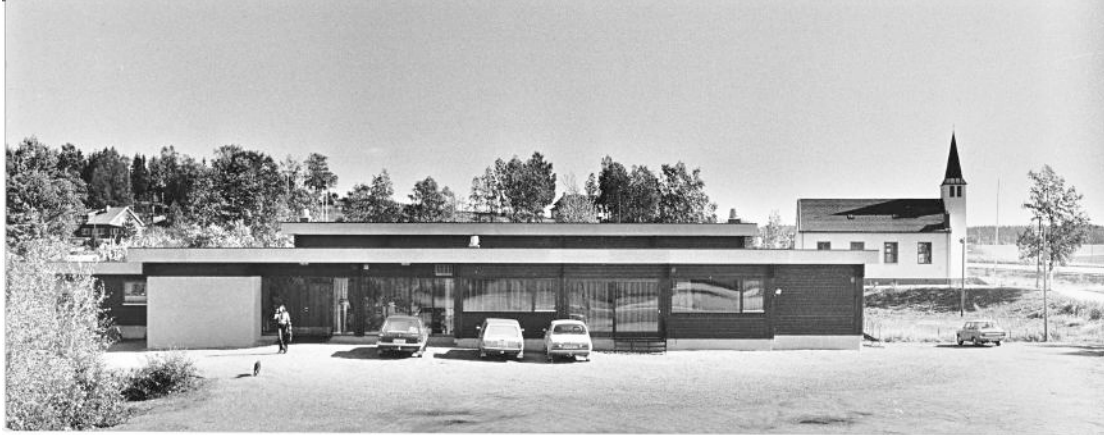
Lierskogen samfunnshus i åpningsåret 1977. Veien fram hadde vært lang. En 50 år gammel drøm var gått i oppfyllelse.

”Jeg foreslår at dere gir ut en håndbok under tittelen: ”Hvordan bygge et samfunnshus.”