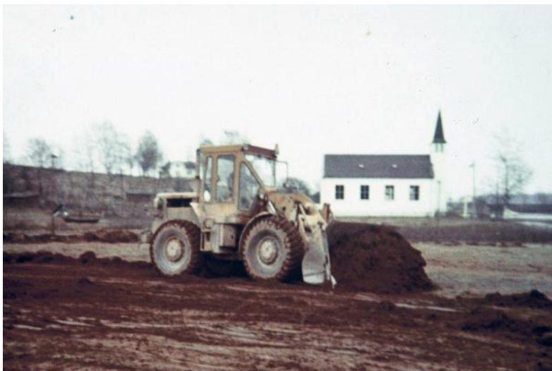
Våren 1976. Prosjektet startet med å fjerne matjord.