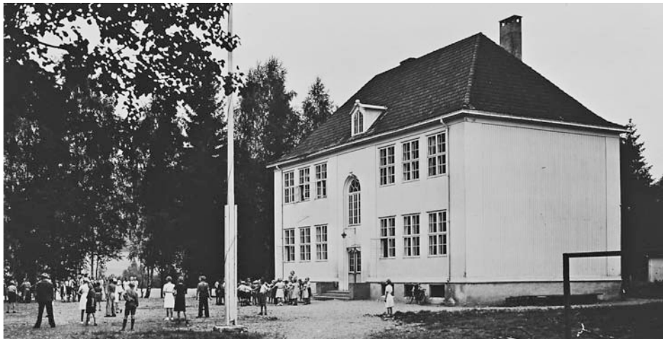
Heia skole 1939. Det var her Heia Husmorlag ble stiftet 31. august 1953, etter at det fra 1950 hadde fungert som en mødreforening knyttet til skolen. Møtene i laget ble holdt på Heia skole til Husmorhuset ble tatt i bruk i 1958.

I møtet 31. august 1953 vedtok foreningen at